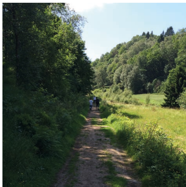
Stien fra Gullestad mot Steindør

Turen starter i Liknes sentrum. Gå over gangbrua over elva og ta til høyre ved Kvinabadet. Fortsett ca 200 meter inn Gullestadvegen og ta til venstre inn på turvei ved turskilt mot Steindør og Ytre Egeland. Når du kommer til bebyggelsen i Steindør, fortsett rett fram ca 300 m på asfaltert vei og ta til venstre ved postkassestativet inn på grusvei. Ved enden av grusveien, ta til venstre på asfaltert vei ut mot hovedveien. Her tar du til venstre inn på gang- og sykkelveien tilbake til sentrum.